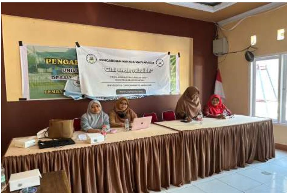
Gambar 1. Sosialisasi PHBS