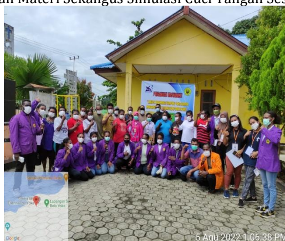
Gambar 7. Dokumentasi Setelah Menyelesaikan Kegiatan Pengabdian Pada Masyarakat