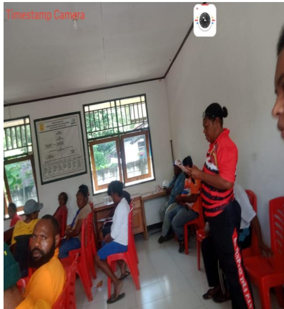
Gambar 5. Peserta Antusias Menanggapi Bertanya dan Berdiskusi Tentang Materi yang Diperoleh

Sebaliknya Sucipto & Istiqomah melakukan edukasi tentang covid-19, penerapan protokol kesehatan di era new normal serta pengenalan masyarakat terhadap PHBS namun kegiatan edukasi kurang maksimal hal ini karena masih ada warga yang tidak merespon positif sehingga perlu adanya persiapan maksimal untuk melakukan kegiatan berikutnya (Sucipto & Istiqomah, 2020). Sebaliknya kegiatan penyuluhan yang di lakukan oleh zakiah, et al di peroleh bahwa pimpinan dan yayasan khairul ummah beserta seluruh guru dan siswa sangat antusias mengikuti kegiatan penyuluhan PHBS menyongsong era new normal (Zakiah, Yuniarti, Rusmilawaty, & Muchtar, 2022) . Sama hal nya yang dilakukan oleh Putri dkk, 2020 setelah diberikan sosialisasi melalui video animasi kepada warga desa ngingit menunjukkan bahwa masyarakat antusias mengikuti kegiatan sosialisasi PHBS di masa new normal (Putri, Setyowati, Putri, & Santi, 2020)