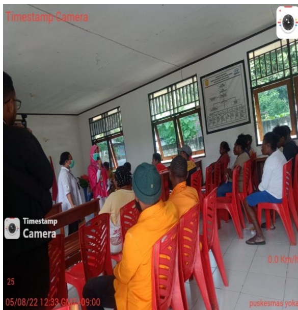
Gambar 4. Pemateri Memberikan Kesempatan Peserta Untuk Menanggapi, Bertanya dan Berdiskusi Tentang Materi yang Telah Disampaikan

Sesi kedua kegiatan masyarakat berkesempatan menanggapi, bertanya dan berdiskusi tentang materi yang telah disampaikan. Para peserta antusias menanggapi, bertanya dan berdiskusi dengan pemateri dan mereka merasa puas dengan penjelasan dan jawaban yang diberikan pemateri. Kegiatan tersebut dapat dilihat pada gambar berikut;