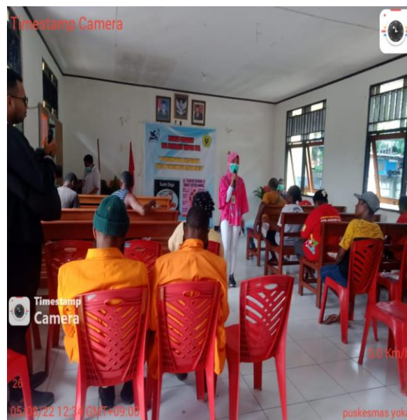
Gambar 2. Penyampaian Materi Tentang PHBS Tatanan Rumah Tangga

Sesi pertama kegiatan dengan melakukan penyuluhan PHBS tatanan rumah tangga meliputi indikator 1) lakukan persalinan di fasilitas kesehatan , 2), memberi asi eksklusif 3) menimbang balita setiap bulan, 4) makan buah dan sayur setiap hari, 5) melakukan aktifitas fisik setiap hari, 6) menggunakan air bersih, 7) mencuci tangan pakai sabun di air mengalir, 8) memberantas sarang nyamuk minimal seminggu sekali , 9) menggunakan jamban sehat, 9) tidak merokok, 10) menggunakan air bersih dilanjutkan penyampaian materi tentang adaptasi kebiasaan baru ‘ new normal ’ pada masa pandemic covid-19 meliputi 1) wajib penggunaan masker, 2) Jaga jarak 1-2 meter, 3) cuci tangan pakai sabun, 4) bawa handsanitizer, 5) tidak bersalaman 6) Gunakan Uang Elektronik, 7) duduk di tempat yang tidak disilang (menjaga jarak), 8) setiba di rumah langsung mandi, 9) Balita dan lansia di rumah aja, 10) Jika sedang flu di rumah aja, 11) makan makanan bergizi dan seimbang, 12) rajin olahraga dan tidak merokok. Proses kegiatan didokumentasikan pada gambar di bawah ini.