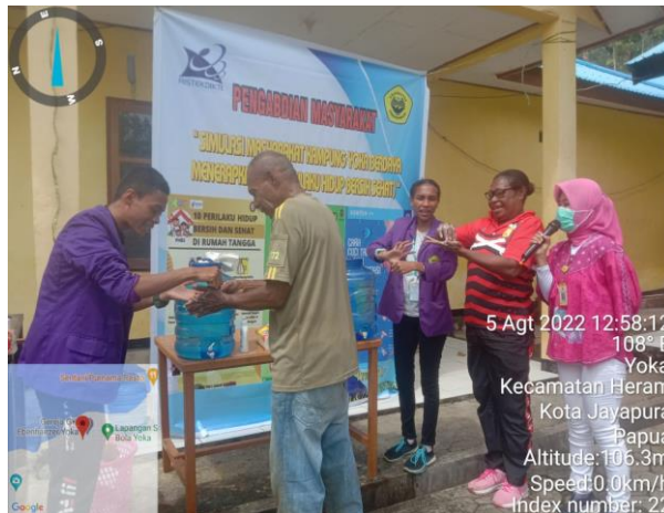
Gambar 6. Penyampaian Materi Sekaligus Simulasi Cuci Tangan Sesuai Rekomendasi WHO

Kegiatan terakhir penyampaian materi cuci tangan sesuai rekomendasi WHO sekaligus simulasi dan dilanjutkan dengan praktik cuci tangan oleh peserta penyuluhan yang ditunjukkan pada gambar berikut;