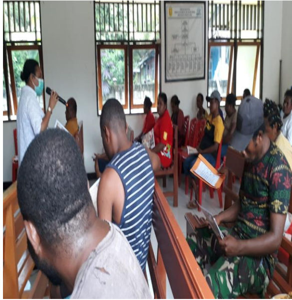
Gambar 3. Penyampaian Materi Tentang Perilaku Adaptasi New Normal Pandemi Covid-19

Sesi kedua kegiatan masyarakat berkesempatan menanggapi, bertanya dan berdiskusi tentang materi yang telah disampaikan. Para peserta antusias menanggapi, bertanya dan berdiskusi dengan pemateri dan mereka merasa puas dengan penjelasan dan jawaban yang diberikan pemateri. Kegiatan tersebut dapat dilihat pada gambar berikut;