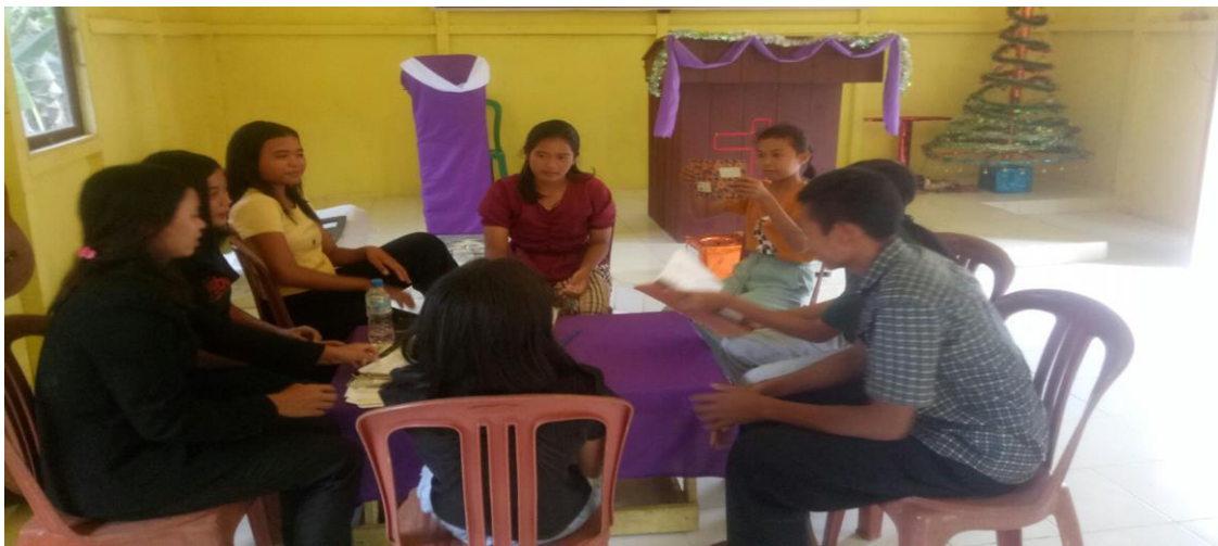
Dokumentasi 1 : Proses Edukasi Pertama Berlangsung

Seorang peserta, berusia 23 tahun bertanya tentang apakah dalam kristen mengizinkan adanya pernikahan kedua, ketiga atau seterusnya. Sehingga dapat diterima jika ada keluarga memiliki 2 isteri atau lebih. Atas pertanyaan itu pemateri menjelaskan dengan dasar Kitab Suci baik Perjanjian Lama maupun Perjanjian Baru. Kekristenan melihat adanya ajaran yang terkoneksi dari Perjanjian Lama maupun Perjanjian Baru bahwa Allah hanya mengizinkan pernikahan sekali saja dan tidak boleh diceraikan atau ditambah. Pemisahan pernikahan oleh perceraian merupakan penghianatan terhadap berkat Allah yang pernah disampaikan pada pemberkatan pernikahan kudus. Demikian juga menambah isteri merupakan bentuk pembangkangan kepada perintah Allah. Kepada suami yang menikah lagi saat isteri masih hidup, dapat juga disebut dengan berjinah. Hal ini tentu berlaku bagi isteri jika memiliki dua orang suami.