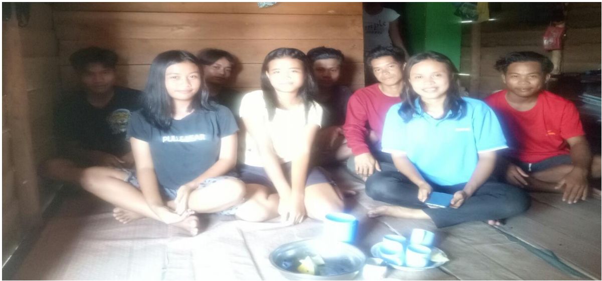
Dokumentasi 2: Proses Edukasi Ke-dua Berlangsung