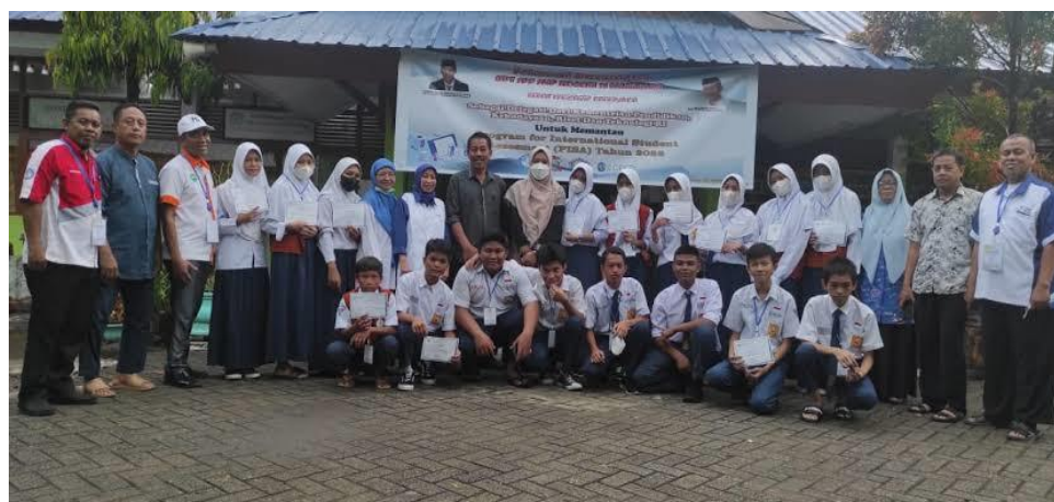
Gambar 2. Foto Bersama Setelah Pelaksanaan