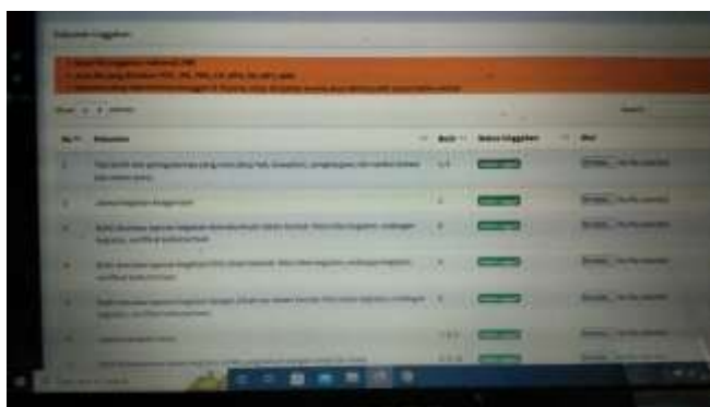
Gambar 3. Laman Dokumen pengunggahan data SDN 001 Empat Balai