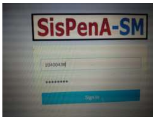
Gambar 1. Laman Login Sispena- SM SDN 001 Empat Balai

Pada workshop tersebut, tim juga menyampaikan bahwa pada setiap komponen penilaian IASP terdapat butir-butir yang harus dipenuhi oleh pihak sekolah agar mencapai penilain yang sesuai dengan standar. Yang perlu diperhatikan dalam pengisian IASP adalah butir penilaian pada komponen mutu lulusan, yaitu siswa menunjukkan perilaku disiplin dalam berbagai situasi. Karena salah satu tim pengabdian merupakan Asesor BAN S/M, maka kami mengingatkan kepada pihak sekolah bahwa seorang asesor akan memberikan level penilaian sesuai dengan level yang telah diperoleh dan dilaksanakan oleh pihak sekolah pada perilaku kedisiplinan siswa yang dilihat dari hasil observasi dan hasil telaah dokumen yang telah disediakan pihak sekolah. Persiapan bukti fisik dan hala-hal yang berkaitan dengan dokumen akreditasi inilah yang disampaikan tim pengabdian kepada kepala sekolah, guru-guru, dan operator SDN 001 Desa Empat Balai. Berikut ini gambar-gambar proses penguplodan berkas-berkas SDN 001 Desa Empat Balai