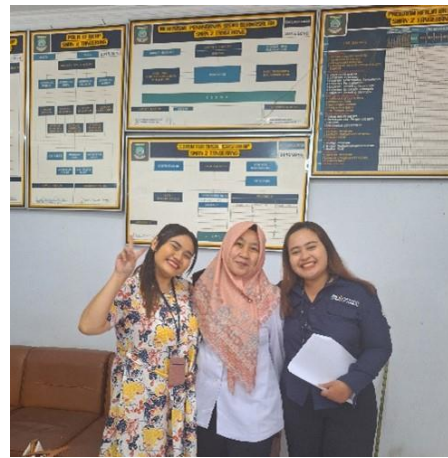
Gambar 1. Foto Kegiatan Identifikasi Kebutuhan