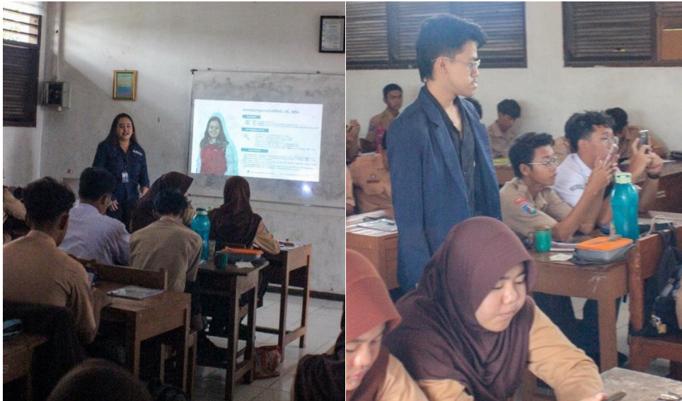
Gambar 2. Sesi Perkenalan dan Pengisian Pretest

memperluas wawasan mereka dan mendorong minat bekerja di bidang ini.