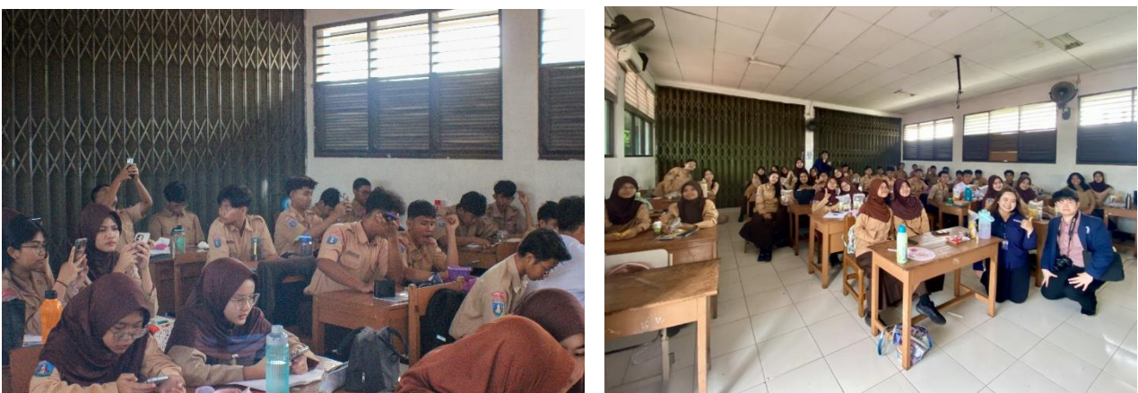
Gambar 4. Pengisian Post-test dan Sesi Foto Bersama

Tidak hanya itu, pertanyaan nomor 6 dan 7 terkait pengetahuan siswa terkait peluang karir di bidang pariwisata serta minat mereka untuk berkarir di industri ini juga mengalami peningkatan yang signifikan. Pada pertanyaan nomor 6, siswa mampu menyebutkan lebih banyak jenis pekerjaan di sektor pariwisata, dengan kenaikan sebesar 17%. Ini menunjukkan bahwa kegiatan ini efektif dalam meningkatkan pemahaman siswa SMAN 2 Kota Tangerang tentang beragam peluang pekerjaan yang ditawarkan oleh industri pariwisata. Selain itu, peningkatan minat siswa untuk berkarir di industri pariwisata juga tampak sebagai hasil dari peningkatan pengetahuan pada pertanyaan-pertanyaan sebelumnya. Pasalnya, pada saat pretest , hanya 27,5% siswa yang tertarik untuk berkarir di industri pariwisata. Namun, setelah pemaparan, lebih dari setengah siswa (52,5%) menyatakan bahwa mereka tertarik untuk berkarir di industri ini. Hal ini membuktikan bahwa kegiatan ini berhasil untuk mencapai tujuan utamanya, yaitu untuk meningkatkan minat siswa siswi SMAN 2 Kota Tangerang untuk berkarir di dunia pariwisata.