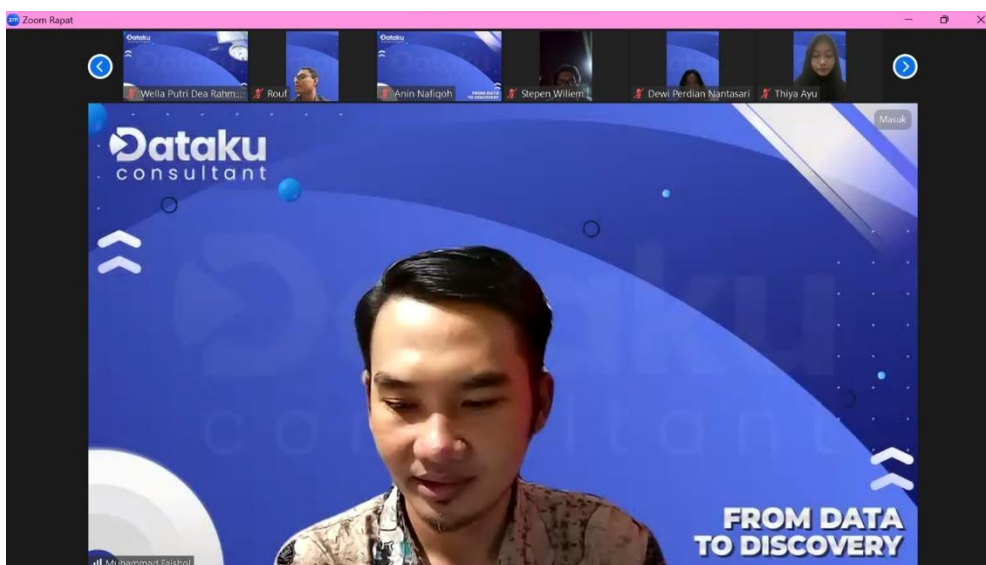
Gambar 2: Penyampaian Materi

Secara keseluruhan, seminar ini memberikan kontribusi positif terhadap pemahaman penelitian kuantitatif di kalangan mahasiswa dan menunjukkan bahwa pendekatan seminar online dapat menjadi sarana yang efektif untuk pelatihan akademik. Pengalaman ini dapat digunakan sebagai dasar untuk perbaikan dan pengembangan seminar sejenis di masa mendatang, dengan penekanan khusus pada peningkatan sesi praktik dan dukungan teknis bagi peserta