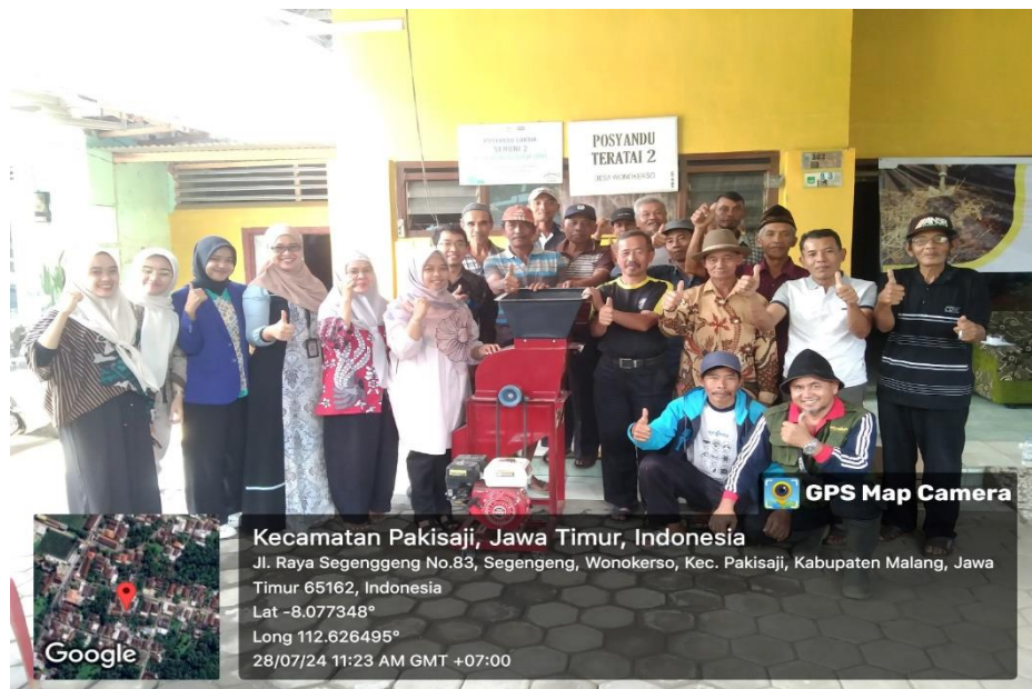
Gambar 5. Foto Bersama Peserta (Dokumentasi pribadi, 2024)

Pada sesi praktik, pupuk organik yang dibuat tidak langsung jadi sempurna, melainkan juga terjadi trial and error . Akan tetapi, setelah beberapa percobaan dan adanya panduan dari narasumber, peserta kegiatan pengabdian berhasil membuat pupuk organik sesuai dengan apa yang telah dicontohkan.