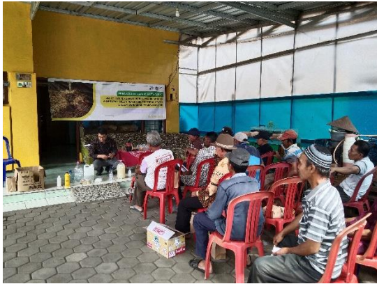
Gambar 3. Pelatihan Pembuatan Pupuk Organik dari Limbah Kotoran Hewan

narasumber, namun terdapat sesi praktik yang dilakukan oleh para peserta. Setelah materi disampaikan dan demonstrasi dilakukan, peserta pengabdian melakukan praktik mandiri membuat pupuk organik didampingi oleh narasumber. Sesuai dengan tujuan pengabdian yaitu meningkatkan keterampilan masyarakat Desa Wonokerso, pelaksanaan praktik pembuatan pupuk organik ini sangat efektif. Praktik yang diikuti oleh peserta pengabdian akan memunculkan pengalaman praktis yang dapat memperdalam pemahaman dan terwujudnya hasil yang tidak hanya bersifat teoritis.