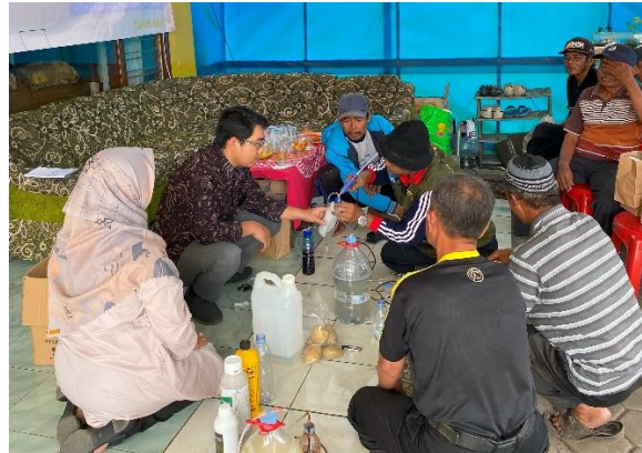
Gambar 4. Praktik Pembuatan Pupuk Organik oleh Para Peserta

Pada sesi praktik, pupuk organik yang dibuat tidak langsung jadi sempurna, melainkan juga terjadi trial and error . Akan tetapi, setelah beberapa percobaan dan adanya panduan dari narasumber, peserta kegiatan pengabdian berhasil membuat pupuk organik sesuai dengan apa yang telah dicontohkan.