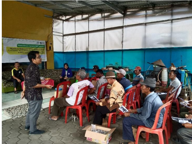
Gambar 2. Penyampaian Materi oleh Narasumber (Dokumentasi Pribadi, 2024)

Kurangnya pengetahuan yang dimiliki petani Desa Wonokerso tentang bagaimana pembuatan pupuk organik dari limbah peternakan menjadi latar belakang utama pengabdian ini dilakukan. Kegiatan pengabdian berfokus pada terlaksananya pengolahan pupuk organik oleh petani Desa Wonokerso menggunakan mesin penghancur. Tim pengabdian melakukan kegiatan sosialisasi dan pelatihan pembuatan pupuk organik menggunakan mesin penghancur. Sebelum dilakukan pelatihan, kegiatan pertama yang dilaksanakan yaitu pelaksanaan sosialisasi atau penyampaian materi. Tim pengabdian kepada masyarakat mendatangkan narasumber yang berkompeten pada bidang pertanian, khususnya pembuatan pupuk organik. Materi yang disampaikan kepada para petani terdiri dari: (1) pengenalan dan urgensi penggunaan pupuk organik (2) manfaat pupuk organik; dan (3) proses pembuatan pupuk organik.