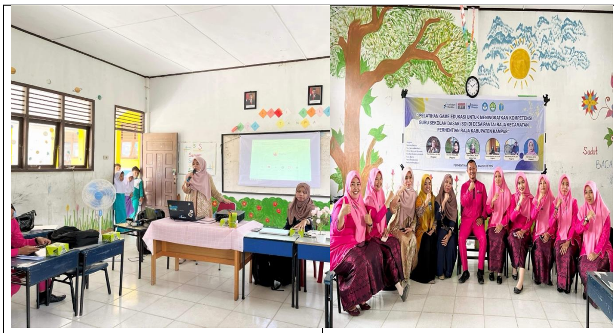
Gambar 2. Dokumentasi Kegiatan Pengabdian