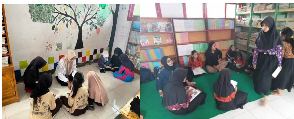
Gambar 1 dan 2 Gambaran kegiatan kelas membaca dilakukan

Peningkatan literasi siswa merupakan salah satu prioritas dalam pendidikan dasar. Literasi yang baik tidak hanya mendukung prestasi akademik, tetapi juga berkontribusi pada pengembangan keterampilan berpikir kritis, empati, dan keterampilan sosial. Di SDN-027 Bengkulu Utara, implementasi kelas membaca di perpustakaan dilakukan sebagai upaya strategis untuk meningkatkan literasi siswa.